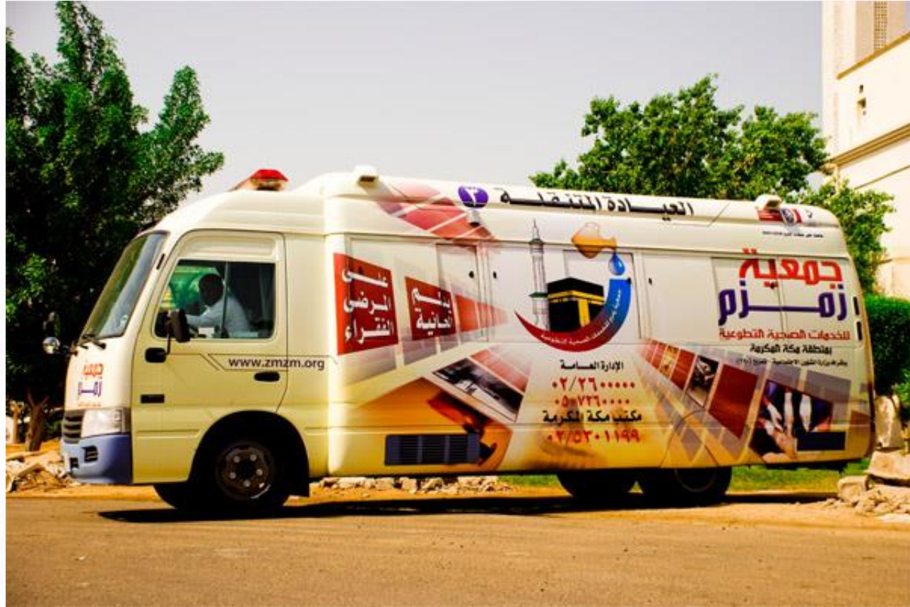
العبادة المتنقلة لجمعية زمزم